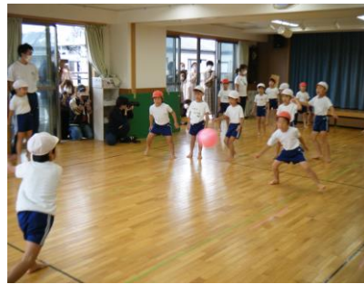
さくらぐみ（5歳児クラス）

和気あいあいとした雰囲気の中で、今まで練習してきた成果を見せると子ども達も気合いが入っていました。練習では出来なかった逆上がりや跳び箱も出来たり、ドッジボールで勝ち負けを経験したりと、普段の様子に近い形で発表できたと思います。最後の運動発表会、よく頑張りました！