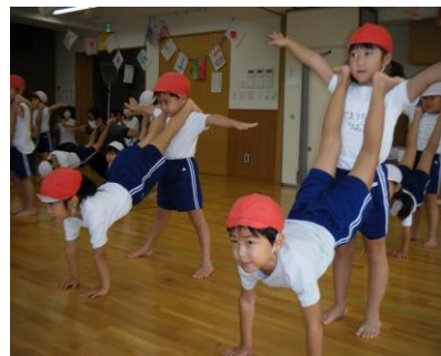
ひまわりぐみ（4歳児クラス）

練習の成果が出せて喜んだり、いつもは出来ていたことが出来ずに悔しい気持ちになったり、沢山の経験が出来ました。お父さん、お母さんの応援でとても頑張っていた子ども達。「楽しかった」「嬉しかった」という声がたくさん聞かれました。